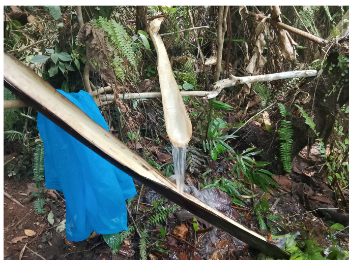
Mga litrato ng alulod sa isang pisikal na base ng naturang yunit ng BHB. Nagmula sa malakas na sapa ang tubig nito.